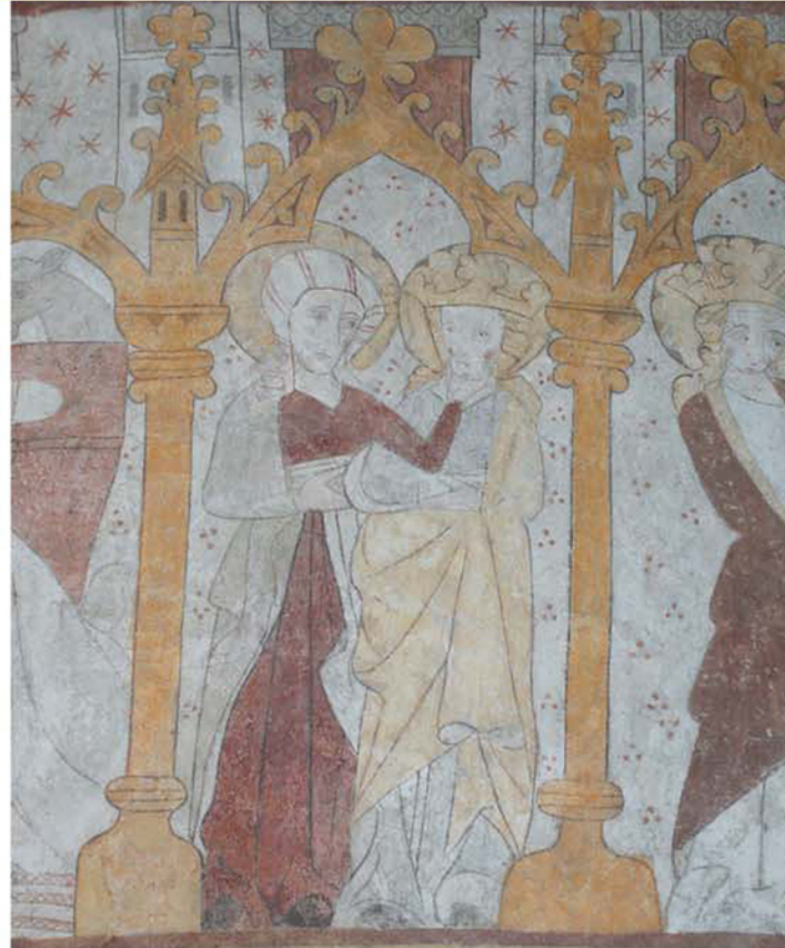
Østerlars Rundkirke, Bornholm ca. 1325-1350